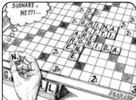
1 - Stereorebus 5 "1" 7 "1": 4! = 5 13 dis. S. Stramaccia MARIELLA