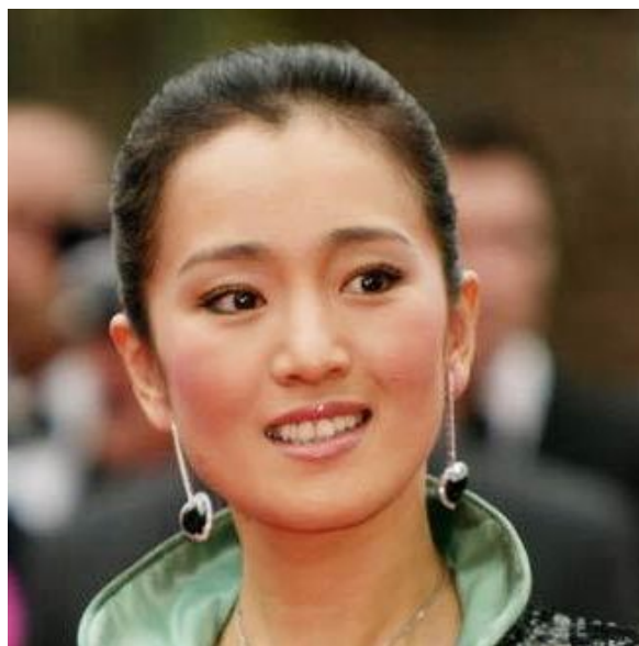
Adora le liriche nazionali