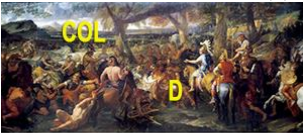
Charles Le Brun, "Alexandre et Porus"