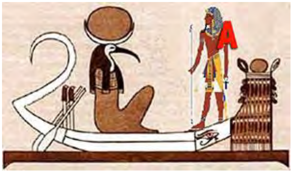
"Nella sua barca vogò a lungo il dio solare: mai il Faraone padre di Micerino"