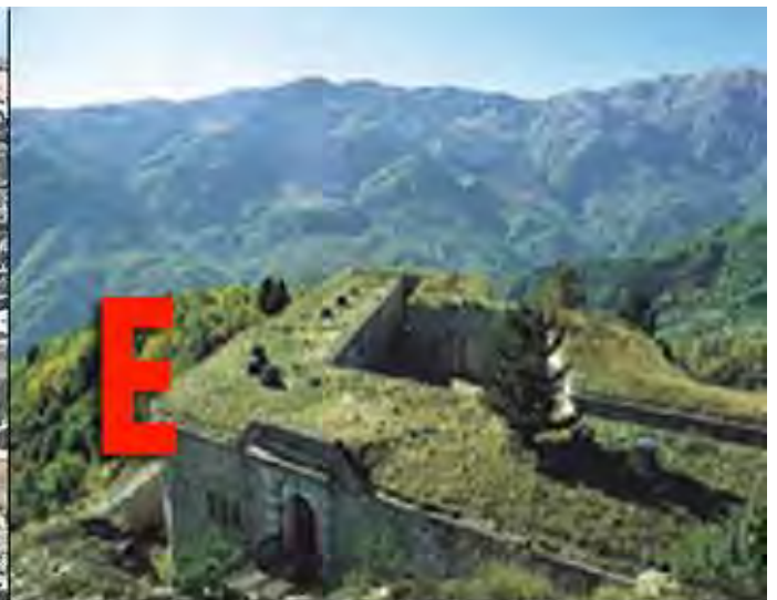
Forte tra le valli Arroscia e Tanaro