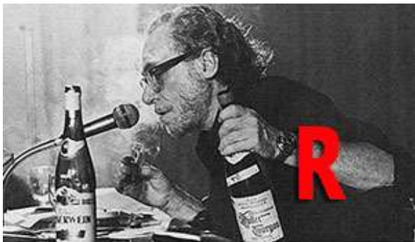
Bukowski recita sue composizioni