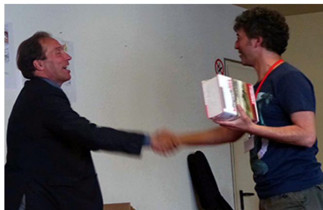
Till premia Superniele, ma Virgilio e Barthleby sembrano perduti in qualche crittografia spaziale, nel bel mezzo della controra!