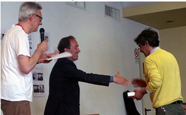
Atlante presenta e Till premia il valente Veleno.