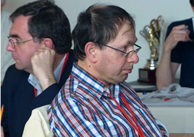
Alkel e Ser Liano guardano ad opposti orizzonti, pervasi da pensieri enigmistici.