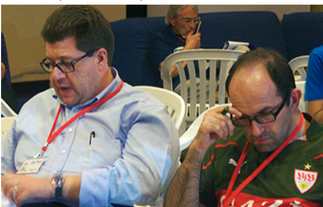
Grande impegno per Oblomov e Il Cozzaro Nero.