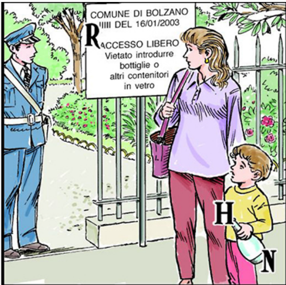
Concorso Briga 2014 - Medaglia d'argento