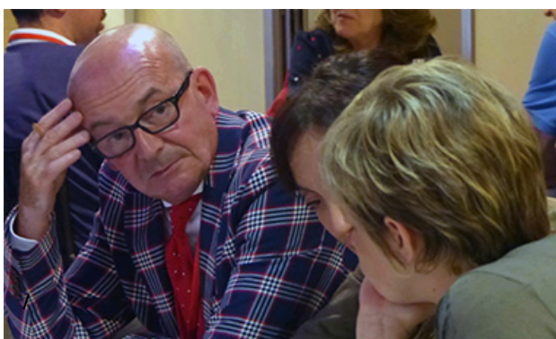
Il Dottor Tibia si consulta... mentre L'Incas decide di ordinare un caffè!