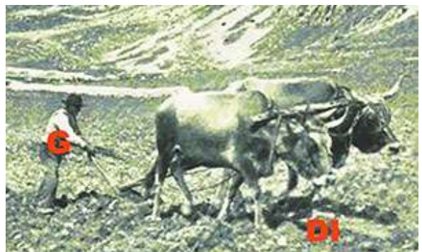
"Fatica e bestemmia"

48. Imago _____ 1 3 2: 5 4 = 4 11 Klaatu