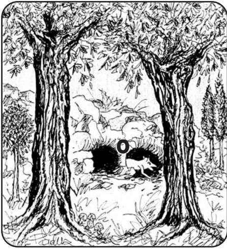
4 - Rebus 3 5 6 2 = "10" 6 dis. S. Stramaccia